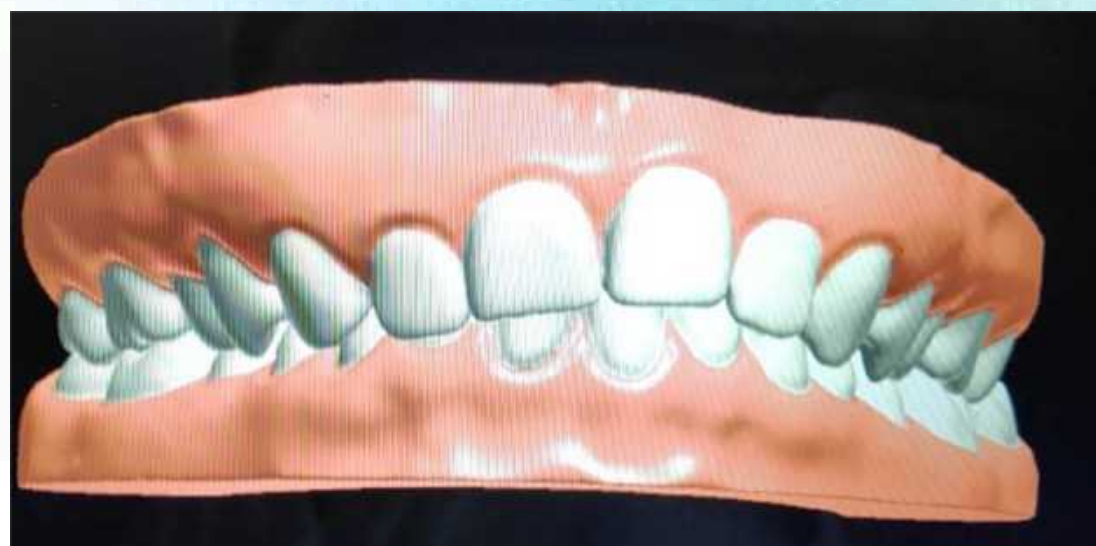
Stan przed leczeniem