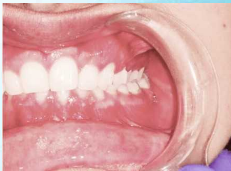
Stan przed leczeniem