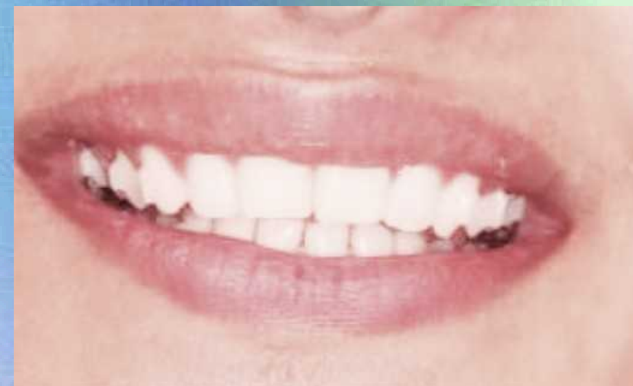
Przewidywane rezultaty po 12–14 miesiącach